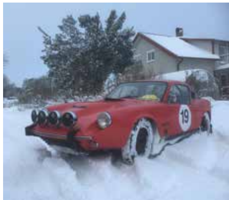
Sabina i snö

Saab 96 V4 och Sonett EV "Sabina" är våra bruksbilar året runt.