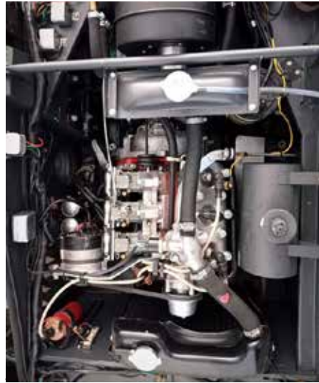
Later Sonett II