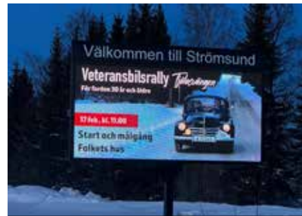
Välkommen till Strömsund