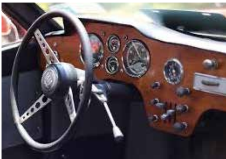
Early but not Sonett 032 (yet)