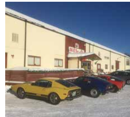
Tjälavängen, 3 Sonetter