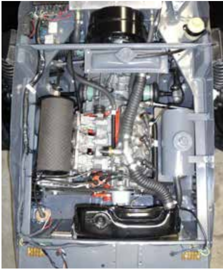
Earlier Sonett II